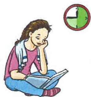
meistens 30 - 45 Minuten Einwirkzeit (unbedingt Packungsbeilage genau beachten)