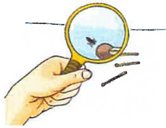
bei Befall mit Kopfläusen oder Nissen