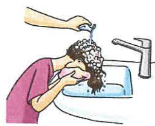
Haare mit der Lösung durchtränken