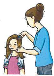
Die nassen Haare am 1., 5., 9. und 13. Tag auskämmen.